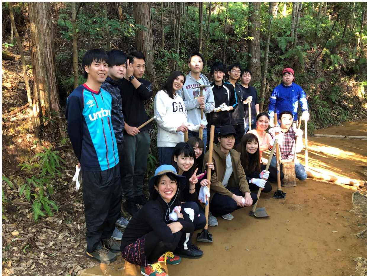
今回の道普請参加メンバー