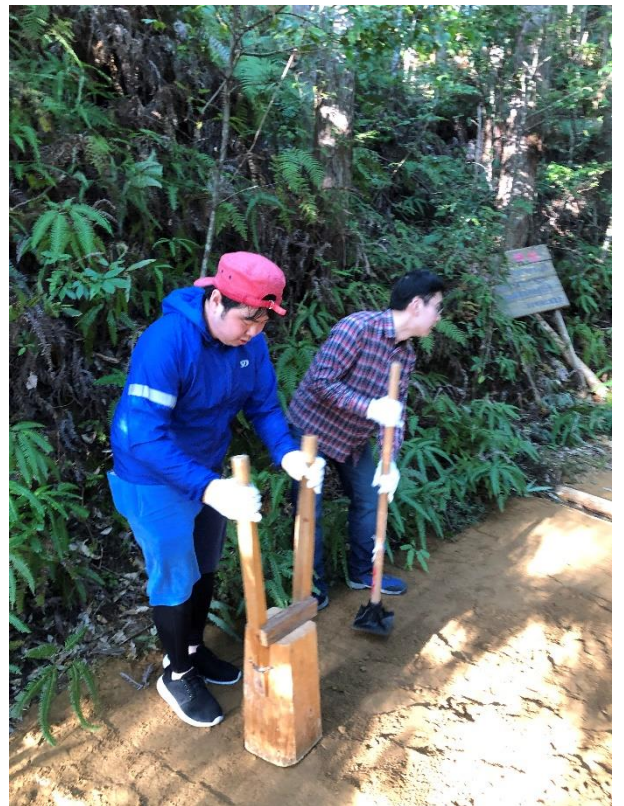
和歌山県のご指導のもと、土を補修地へ広げて突き固めます。 相撲の土俵を固める日本古来の道具「タコ」などを用います。